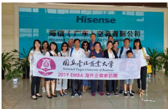
圖 1 107-廣東海信空調有限公司