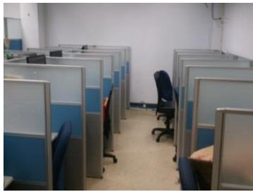
圖 3 研究生研究室

一、本系現有行銷流通專業教室、個案教學專業教室、商業智慧實驗室、財務金融實驗室及研究所專業教室 2 間等，共計 6 間專業教室，另有 1 間會議室、2 間小型研討室及 2 間研究生研究室。