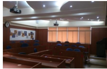
圖 4 企管系研究所專業教室

二、本系碩士在職專班於民國 95 年成立，每年均與在學碩士生共同辦理諸多活動，包括於年初辦理春酒、年中辦理迎新送舊及年末辦理秋遊，以增進校友間及師生間的聯繫與互動。