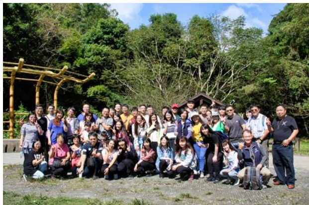
圖 7 108 年秋遊