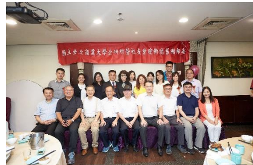
圖 6 108 年迎新送舊