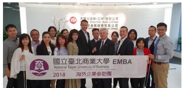
圖 2 106-香港永豐金控