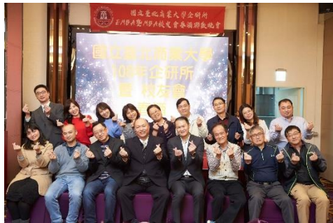
圖 5 108 年春酒

二、本系碩士在職專班於民國 95 年成立，每年均與在學碩士生共同辦理諸多活動，包括於年初辦理春酒、年中辦理迎新送舊及年末辦理秋遊，以增進校友間及師生間的聯繫與互動。