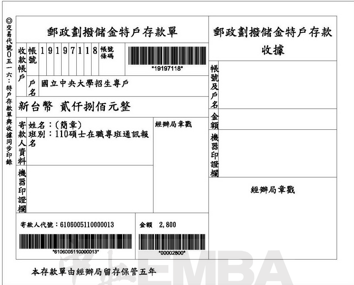
(表三) 郵局劃撥儲金特戶存款單